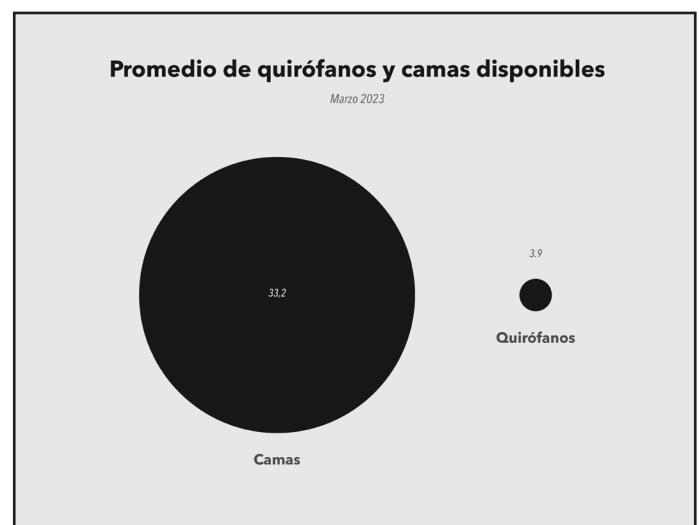
Gráfica 2: Promedio quirófanos y camas disponibles (Mar. 2023)