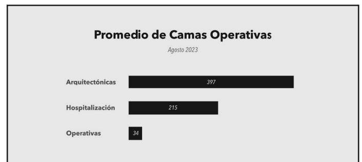
Gráfico 1: Promedio de Camas Operativas (Ago. 2023)

Sin embargo, como podemos observar en el siguiente gráfico, la cantidad de camas operativas está por debajo de la capacidad arquitectónica que tienen los hospitales originalmente. Es decir, que hoy en Venezuela, independientemente de la razón, no se están utilizando los hospitales al 100% de su capacidad.